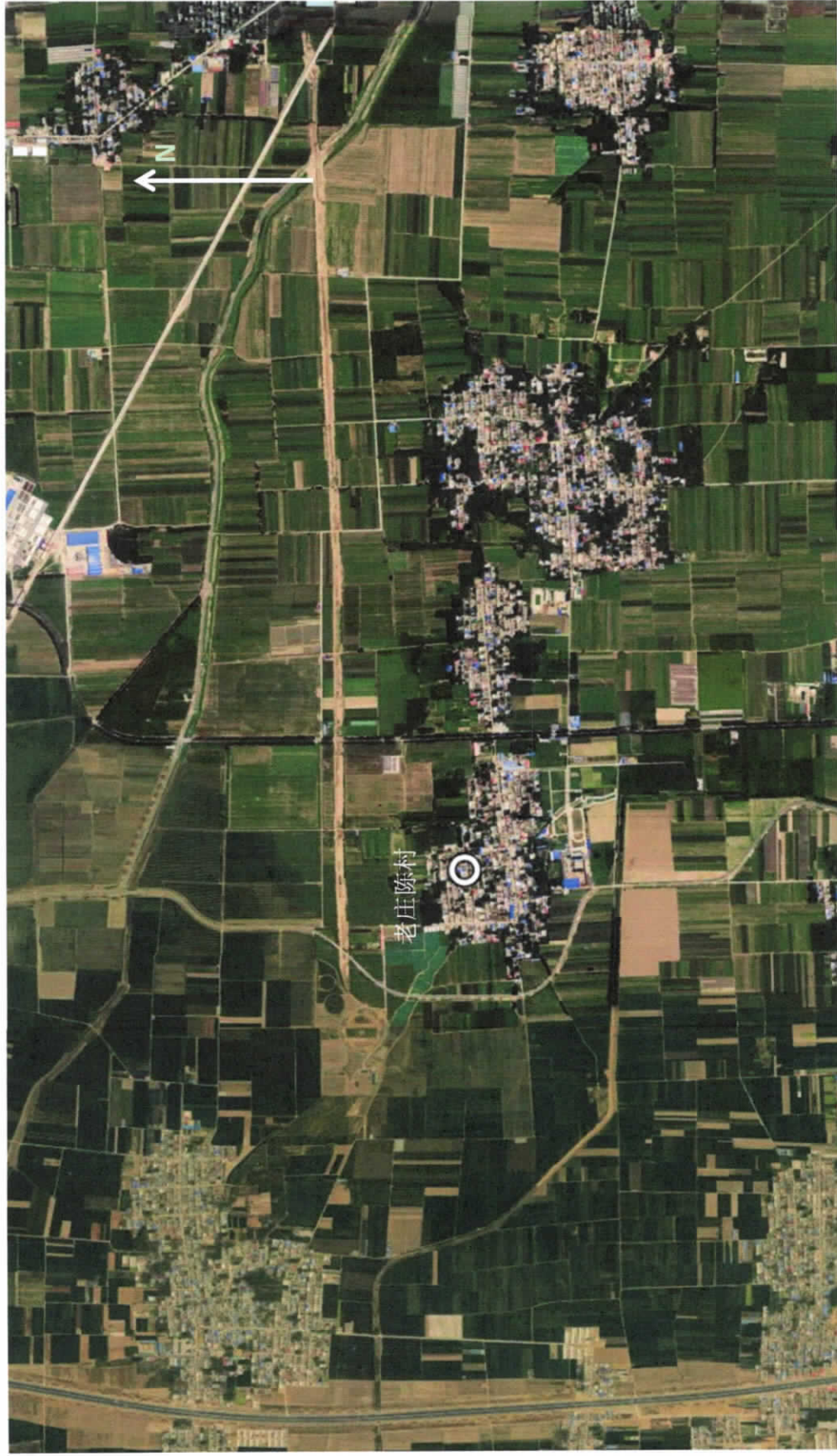
图例：○ 环境空气点位